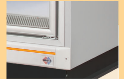
• Shock-resistance plastic bumper