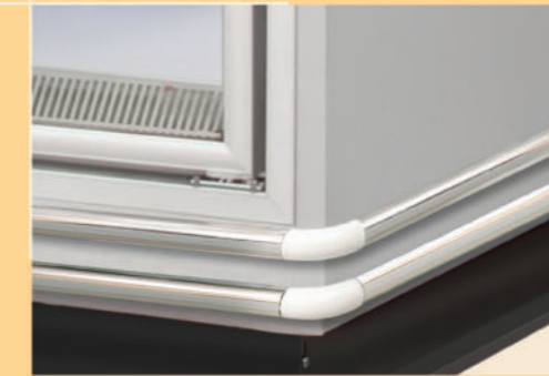
• Stainless Steel bumper